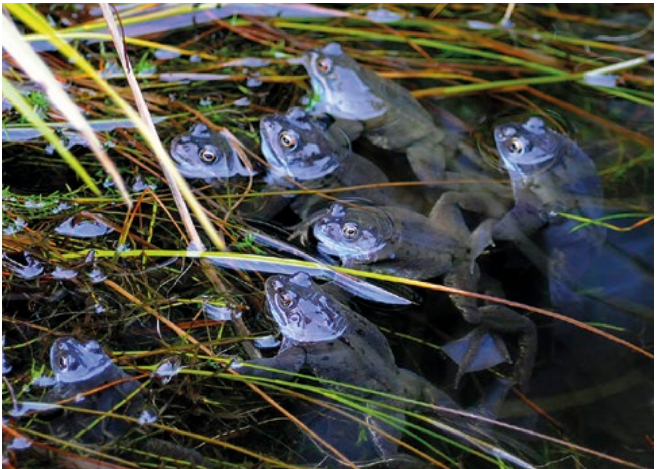
An Frog Coiteann ( Rana temporaria )

Táthar tar éis 75 Limistéar Oidhreachta Nádúrtha (LON) is portaigh ardaithe a shainiú faoi na hAchtanna um Fíadhúlra. Sainíodh na suíomhanna mar chuid d'fhreagra ar chaingean sáraithe a thug Coimisiún an AE i gcoinne na hÉireann i ndáil le forfheidhmiú na Treorach um Measúnacht Tionchair Timpeallachta do bhaint na móna. Foráiltear cosaint do na LON sna hAchtanna um Fíadhúlra tríd an gceanglas do roinnt gníomhaíochta a d'fhéadfadh bheith díobhálach chun toiliú Aireachta a fháil sula ndéantar iad. Is iondúil go liostaítear baint na móna, oibreacha draenála agus an foraoisiú mar ghníomhaíochtaí óna dteastaíonn an toiliú úd. Is amhlaidh dá bharr atá próiseas toilithe déach ann i gcás an fhoraoisithe agus leagan na gcrann, óir go dteastaíonn toiliú ó na gníomhaíochtaí úd ón Aire Talmhaíochta, Bia agus Mara. Cuireadh an maolú a bhain do bhaint na móna don teaghlach sna LCS is portaigh ardaithe chun feidhme freisin i leith na LON, agus tá sé fós i bhfeidhm. Is amhlaidh go ginearálta dá réir nár cuireadh na ceanglais sin chun feidhme i ndáil le baint na móna. Déantar foráil don Aire chun ligean do ghníomhaíochtaí díobhálacha mar arb ann do chúiseanna riachtanacha sáraitheacha ó leas an phobail.