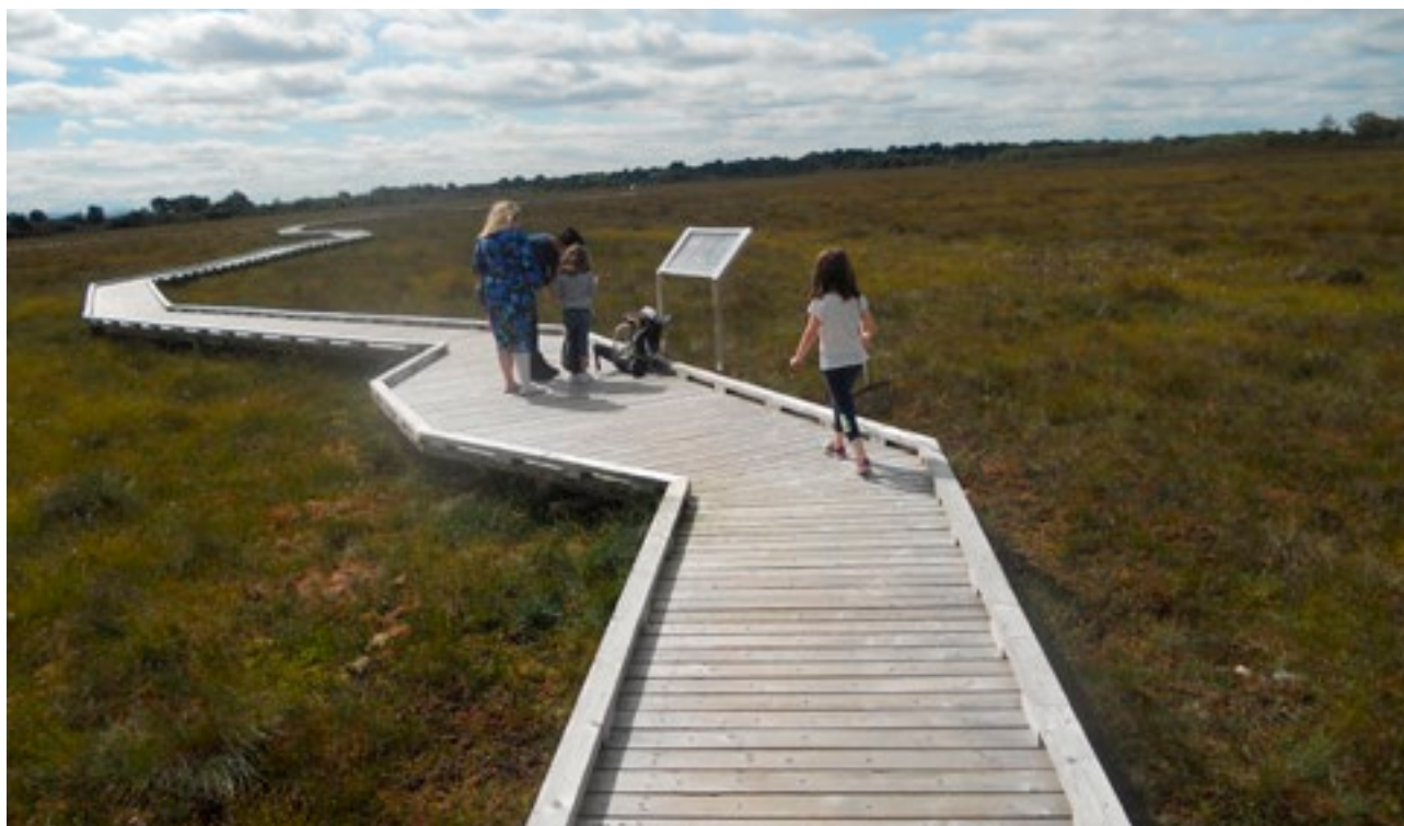
Fotheideal grianghraif: Clárchosán Phortach Chlóirhigh, Co. Uíbh Fhailí

Athbhreithneoidh na húdaráis phoiblí ábhartha a gcuid gníomhaíochtaí agus cur chuige i leith oideachais agus feasachta an phobail faoi luach agus úsáidí na dtailte móna; agus tabharfaidh siad achoimre ar thoradh a n-athbhreithnithe do Ghrúpa Forfheidhmiúcháin na Straitéise Tailte Móna. Is é an Grúpa Tailte Móna, i gcomhairle leis an gComhairle Tailte Móna, a dhéanfaidh measúnú ar ghníomhaíochtaí reatha, lena n-áirítear iad siúd de chuid na n-eagrais neamhrialtasach, agus a dhéanfaidh moltaí don Rialtas maidir le tuilleadh beart a d’fhéadfadh bheith de dhíth chun tairbhí eacnamúla, sóisialta agus comhshaoil an bhainistithe fhreagraigh ar thailte móna a chur in iúl don phobal. Is sa chomhthéacs sin a bhreithneoidh an Grúpa Tailte Móna moltaí na Tuarascála Bogland.