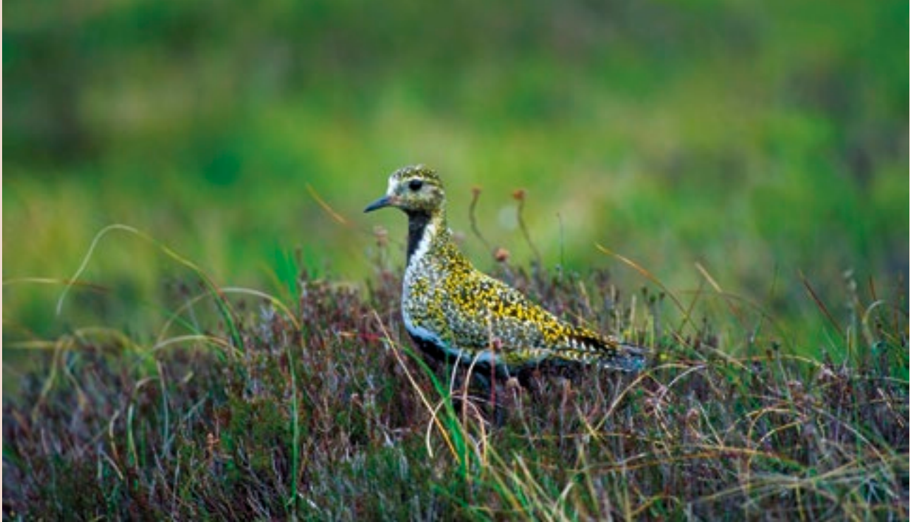
Feadóg Bhuí ( Pluvialis apricaria )

Éiríonn forbairt na Straitéise Náisiúnta um Thailte Móna foriomláine as an éileamh chun cur chuige straitéiseach leathan a ghlacadh do bhainistiú tailte móna na hÉireann amach anseo. D'éirigh deacrachtaí aníos d'Éirinn chun ceanglais dlíthiúla an AE a shásamh mar thoradh ar bhearnaí agus laigeachtaí beartais i ndáil le rialáil na gníomhaíochta ar thailte móna nach beag na hÉireann (os cionn 20% d'achar talún an Stáit).