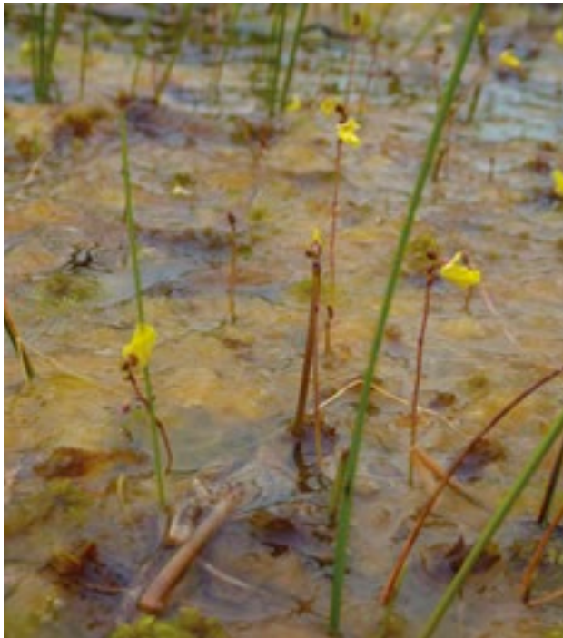
Lus borraigh beag ( Utricularia minor )

Rinneadh moltaí sonracha i leith an oideachais agus na hoiliúna i dtrí cháipéis thábhachtach idirnáisiúnta inar pléadh úsáid chliste na dtailte móna. Is iad sin comh-threoirlínte Wise Use guidelines for Global Mires and Peatlands de chuid an Grúpa Caomhnaithe Puiteach Idirnáisiúnta agus an Cumann Móna Idirnáisiúnta, agus Responsible Peatland Management Strategy an Cumann Móna Idirnáisiúnta agus an Global Action Plan for Peatlands de chuid Ramsar. Tugtar nod sna cáipéisí úd don ghá chun cláir phríomhshrutha oideachais agus oiliúna a fhorbairt agus a fhorfheidhmiú ag díriú ar thailte móna. Leagtar béim iontu nár cheart go mbainfeadh cur na feasa agus na faisnéise ar aghaidh leis na cláir úd amháin, ach go gcaithfí féachaint leo chun iompar a mhodhnú agus stíleanna beatha a fhorbairt ar comhchuí le húsáid chliste na dtailte móna iad. Baineann an impleacht leis sin go gcaithfidh siad leanúint ar aghaidh ar feadh an tsaoil agus a bheith dírithe ar gach aon earnáil den tsochaí - saoránaigh, pobail, gnólachtaí agus tionscal. Is i bPlean na hÉireann um Chaomhnú Tailte Móna 2020 ag an Leibhéal náisiúnta, arna ullmhú ag Comhairle Chaomhnaithe Phortaigh na hÉireann, a dhéantar roinnt moltaí straitéiseacha don Rialtas i ndáil leis an oideachas comhshaoil.