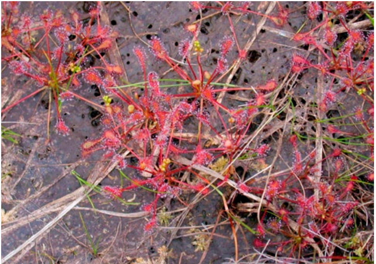
Drúchtín Móna ( Drosera rotundifolia )