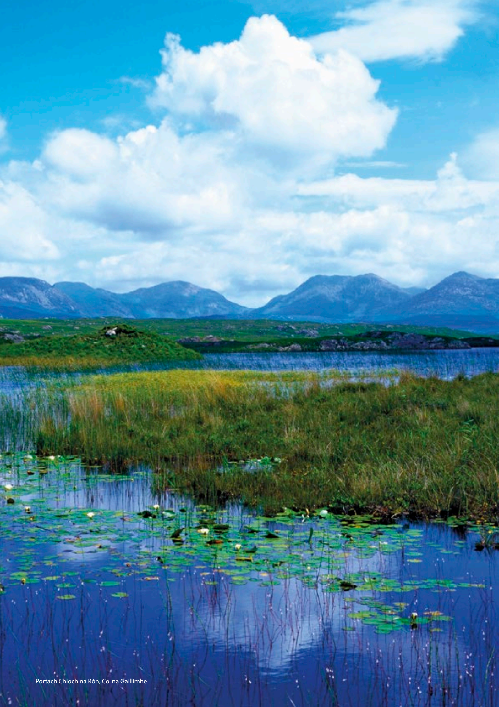
Portach Chloch na Rón, Co. na Gaillimhe