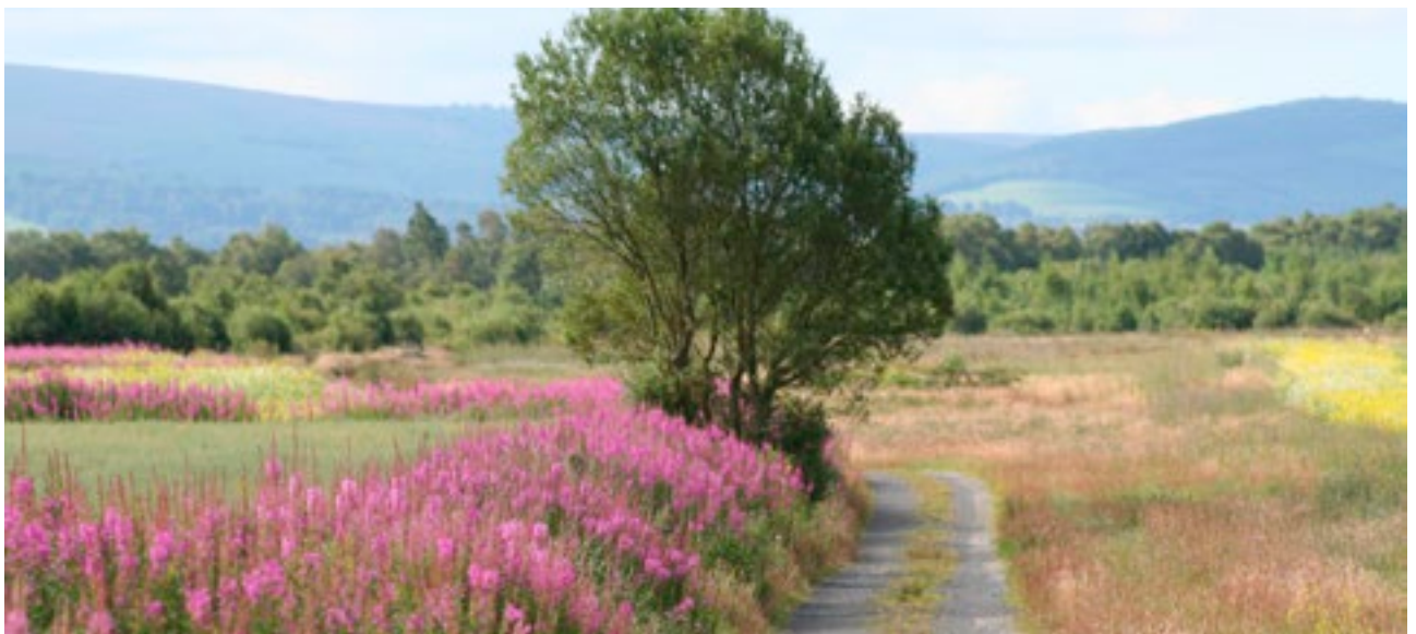
Athchóiríú Bhord na Móna ag Loch na Buaráí, Co. Uíbh Fhailí