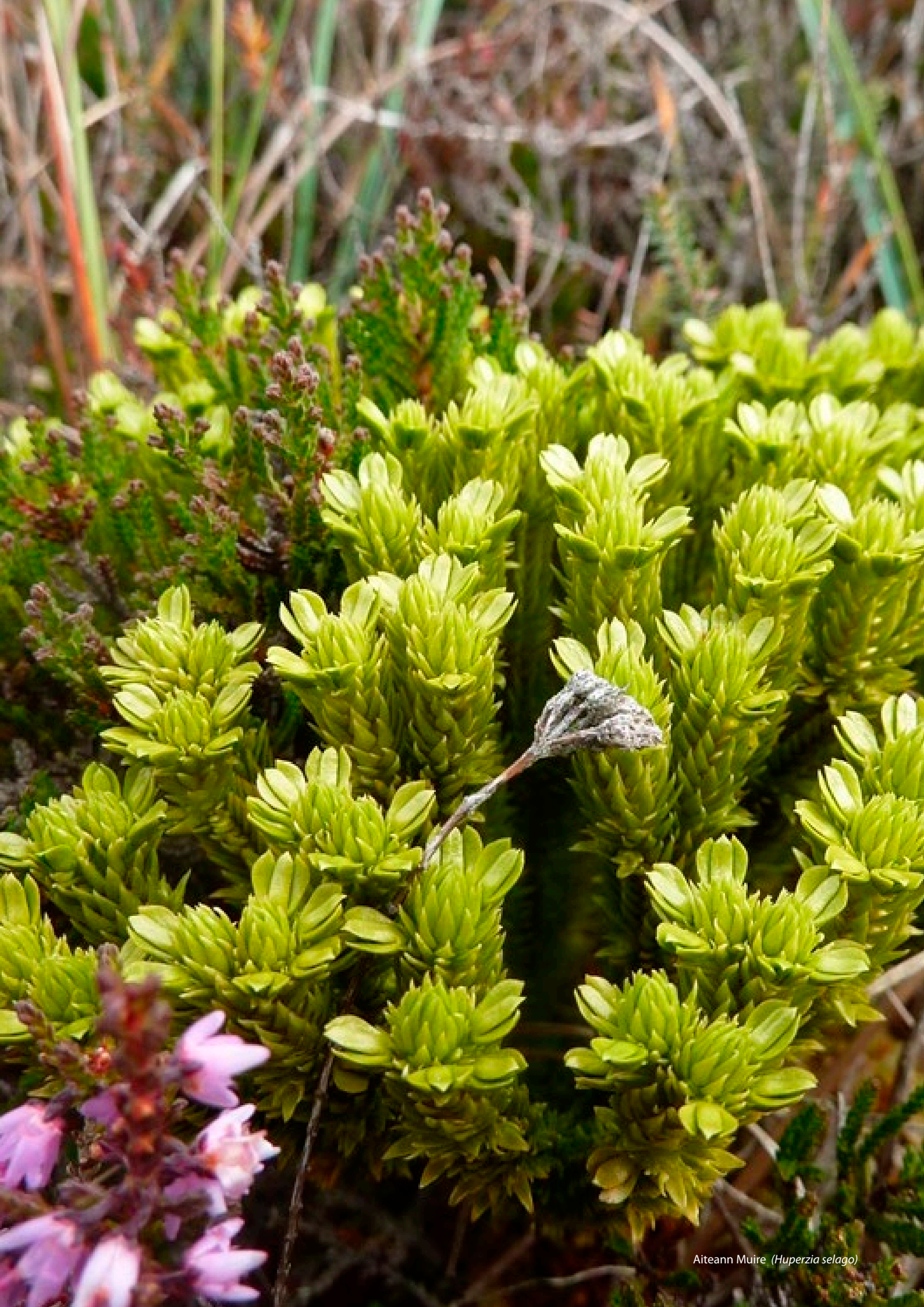
Aiteann Muire ( Huperzia selago )