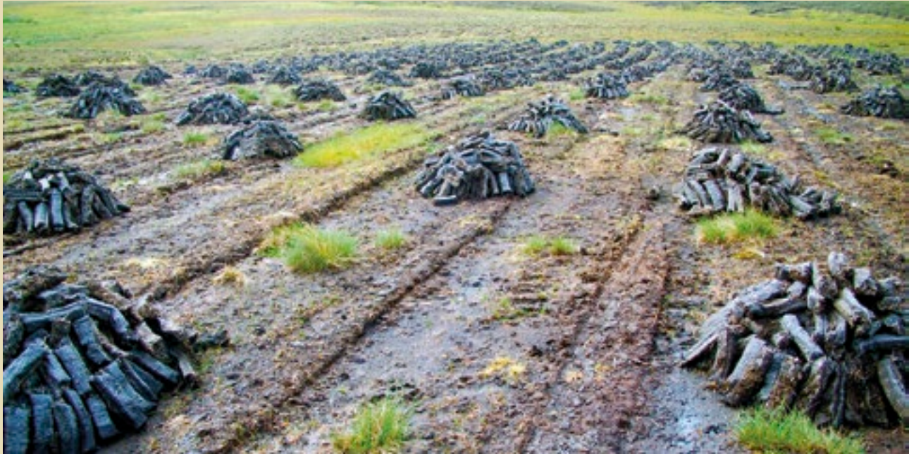
Baint na Móna, Cnoic Shíofra, Co. Mhaigh Eo

Is éicea-chórais bhogaigh iad na tailte móna le cruachadh an ábhair orgánaigh ar a dtugtar móin mar eochairghné leo; tagann an t-ábhar móna sin ó ábhar plandaí marbha agus atá ag dreo go mall faoi choinníollacha fliuchrais. Is portaigh den chuid is mó atá i dtailte móna na hÉireann, agus cion beag eanach ann. Tá riocht nádúrtha ar roinnt de na portaigh agus na heanaigh, ach táthar tar éis an tromlach a athrú ag lámha an duine.