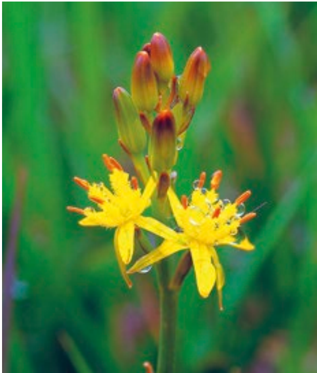
Sciollam na Móna ( Narthecium ossifragum )

Tá na tailte móna tar éis bheith mar chuid de thórdhreach na hÉireann ón Oighear-Aois ba dhéanaí, agus is cuid dár n-éiceachórais is sine iad in éineacht le hiarmhair na bhforaoisí cianaosta. Is iad tailte móna na tíre an fiántas deiridh atá againn, agus iad leathbhealach idir talamh agus uisce, ag soláthar gnáthóg neamhghnách dá bhflóra agus fána uathúil agus sainiúil. Clúdaíonn siad achar mór de dhromchla na talún, mar phortaigh ardaithe, mar bhratphortaigh nó mar eanaigh; agus is tírdhreacha suaithinseacha iad i go leor codanna den tír.