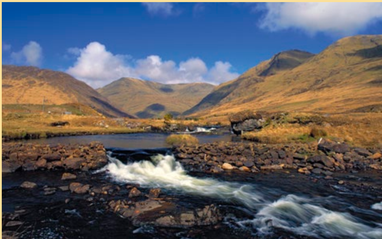
Gleann Delphi, Co. Mhaigh Eo

Baineadh leas as taitle móna don fhoraoisiú, do bhaint teaghlaigh agus thionsclaíoch na móna, d'íníor agus míntíriú talmhaíochta agus baineadh leas astu i gcomhair cineálacha éagsúla forbartha bonneagair. Féadann taitle móna na hÉireann bheith fós mar óstionad do na gníomhaíochtaí úd amach anseo. Chuaigh Bord na Móna i mbun táirgeadh móna ar scála mór sna portaigh ardaithe agus lagphortaigh san fhichiú haois, a bhunaigh an Stát chun na críche sin agus a dhíríonn go príomha anois ar na portaigh ardaithe draenáilte i lár tíre na hÉireann. Rannchuireann na gníomhaíochtaí úd go mór i gcónaí leis an bforbairt eacnamúil trí thacaíocht a thabhairt don fhostaíocht go díreach agus go hindíreach chomh maith le foinse shlán fuinnimh dhúchasaigh a sholáthair. Draenáladh agus míntíriodh go leor taitle móna na hÉireann dá leas sa talmhaíochta agus san fhoraoiseacht freisin. D'éirigh feasacht agus léirthuisicint le déanaí i measc eochairlucht ceaptha beartais agus i measc an phobail i gcoitinne faoi luachanna eile na bportach feidhmeach agus faoi na tairbhí a bhaineann leo.