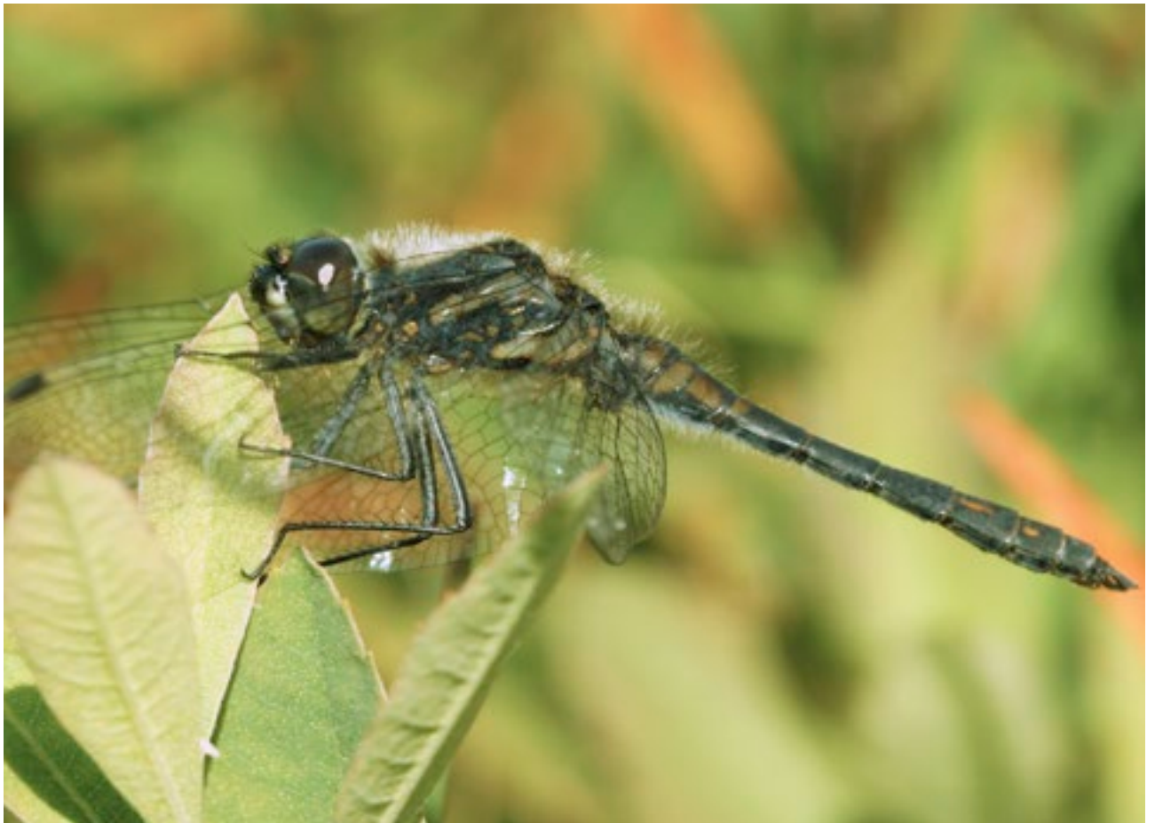
Sciobaire Dubh ( Sympetrum danae )

Foráiltear do bhealach ar aghaidh mar chuid den Straitéis seo. Foilsíodh an Dréachtphlean um Bainistiú Náisiúnta LCS is Portach Ardaithe i mí Eanáir 2014 i dteannta le hathbheithniú cuimsitheach ar Limistéir Oidhreachta Nádúrtha (LONí) agus ar phortaigh ardaithe neamhshainithe, arna múnú ag athchumrú radacach ár ngréasán LONí. Forálfar leis sin do thorthaí caomhnaithe rífheabhsaithe, agus seachnófar na limistéir ina mbaintear go leor móna agus laghdóidh sé na costais go mór don cháiniocóir. Áireofar roinnt portach faoi úinéireacht Bhord na Móna a tháinig faoi réir iarrachta caomhnaithe agus athchóirithe saindirithe ag an gCuideachta, leis an ngréasán LON. Áireofar leis freisin suíomhanna eile lena mbaineann luach caomhnaithe mar nach mbaintear mórán móna ná móin ar bith. Táthar ag dúil go ndíshaineofar go leor suíomhanna mar chuid den phróiseas seo atá ina Limistéir Oidhreachta Nádúrtha is portaigh ardaithe i láthair na huair. Beidh sé sin mar chúnaimh chun tacú ó bhonn le cosaint na LCS is portaigh ardaithe.