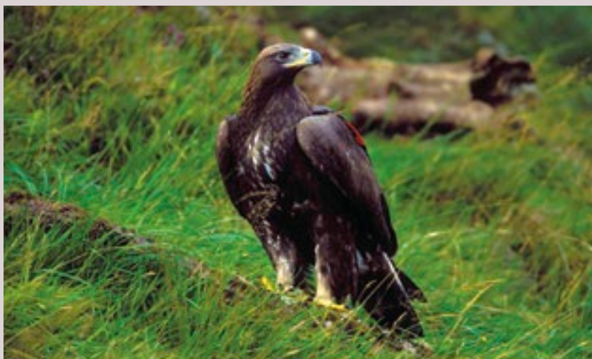
Iolar Fíréan ( Aquila chrysaetos )

Áiríodh leis na tionscadail LIFE in Éirinn go nuige seo athbhunú an Iolair Fhíréin agus dhá thionscadal athchóirithe do Phortaigh Ardaithe agus Bratphortaigh. Tá a thuilleadh mionsonraí i leith gach tionscadal ar fáil ag http://ec.europa.eu/life .