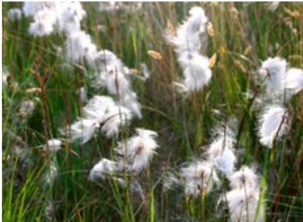
An Ceannbhán Caolduilleach ( Eriophorum angustifolium )

Tá na ceanglais dlíthiúla i ndáil le baint na móna agus an próiseas pleanála tar éis athrú de réir a chéile ó tugadh isteach an córas pleanála i mí Dheireadh Fómhair na bliana 1964. Is fairsing iad na forbairtí ón mbliain 1990 i leith, ach tugtar achoimre ar roinnt de na príomhathruithe thíos.