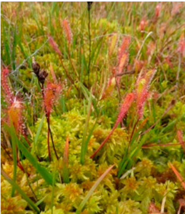
Cailís Mhuire Mhór ( Drosera anglica )

Is baile iad na portaigh do go leor plandaí tearca agus cosanta. Áirítear le gnáthphlandaí portaigh na caonaigh sfagnaim, luachair agus cíbeanna, ceannbhán, fraoch mór, lus na móinte, sciollam na móna agus drúichtín.